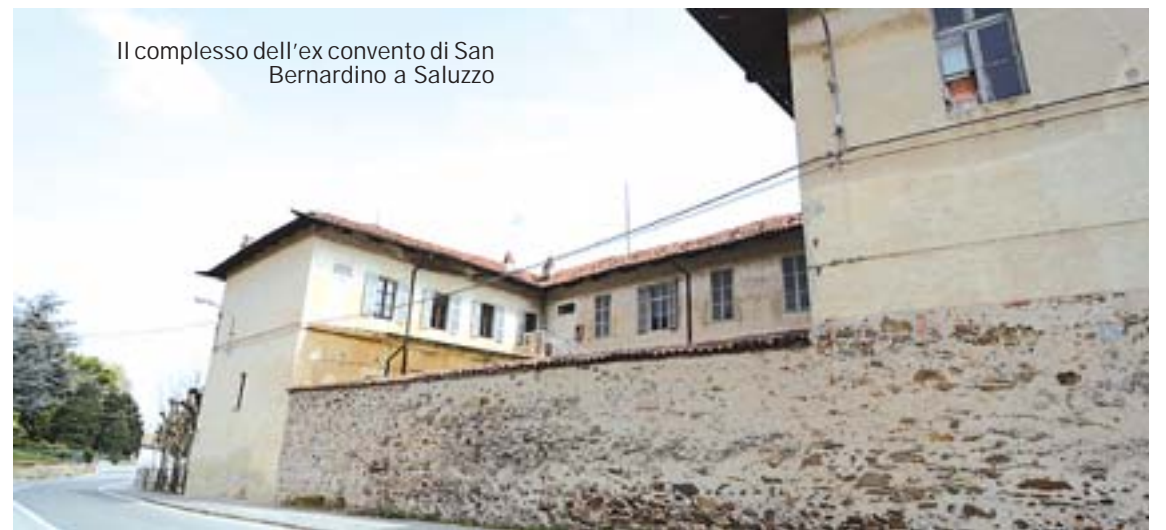
Il complesso dell'ex convento di San Bernardino a Saluzzo