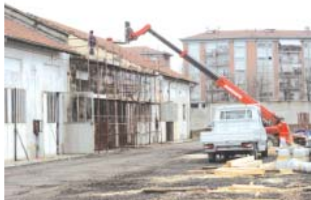
Lavori in corso nell'ex caserma Filippi

In questi giorni hanno preso il via i lavori di sistemazione del tetto di uno dei magazzini dell'ex caserma che si affaccia sugli orti urbani e sul campo di marte. L'obiettivo è garantire una sistemazione mini-