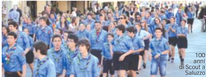
100 anni di Scout a Saluzzo

Quanti numeri compongono la nostra vita? In tante occasioni del giorno compaiono i numeri? Sono talmente tante e così ricorrenti che non ce ne rendiamo conto: dalla banalità di qualsiasi pagamento con le cifre del resto, del prezzo, dal bigliettino per la fila allo sportello della posta o del supermerca-