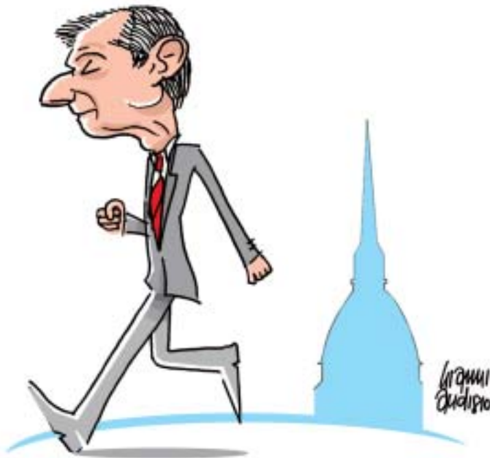
MAGRA FIGURA DI FASSINO

modificata la legge urbanistica per favorire le aziende