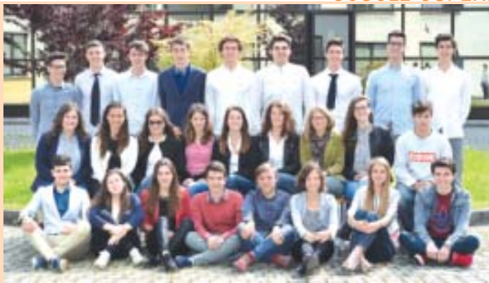
La classe VA del liceo Bodoni di Saluzzo

SCUOLE SUPERIORI DI SALUZZO, BARGE, VERZUOLO