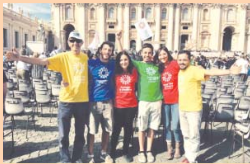
Gli operatori del Gruppo presidio Caritas a "braccia aperte" in piazza San Pietro a Roma