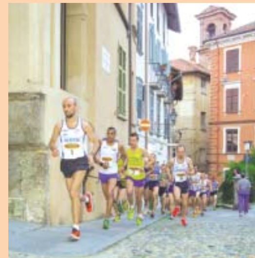
Un'immagine della corsa saluzzese "Tra le Antiche Mura", nel centro storico cittadino, che diverrà il percorso del Campionato Italiano