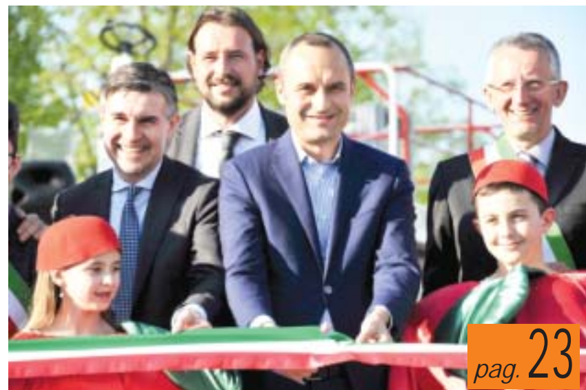
Il ministro Enrico Costa al taglio del nastro di Fruttinfiore