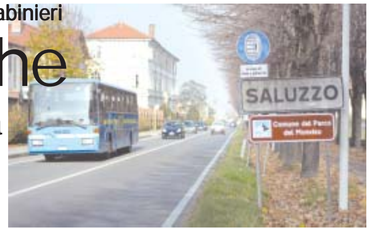
L'ingresso a Saluzzo da via Cuneo e, sotto, da via Torino

Un sistema veloce e sicuro per identificare in pochi attimi veicoli sospetti, auto rubate e avere il controllo di chi transita nel territorio della città di Saluzzo. Senza contare che ogni singolo Targa System installato sul territorio, dispone di una black list condivisa che consente il dialogo real time tra tutti i sistemi attivi in Italia. Una sorta di grande fratello digitale dalla parte della giustizia, che dovrebbe dare una bella mano nella prevenzione di molti tipi di reato. Nella nostra zona il sistema di riconoscimento delle targhe è già utilizzato a Busca e a Bra. fabrizio scarpì