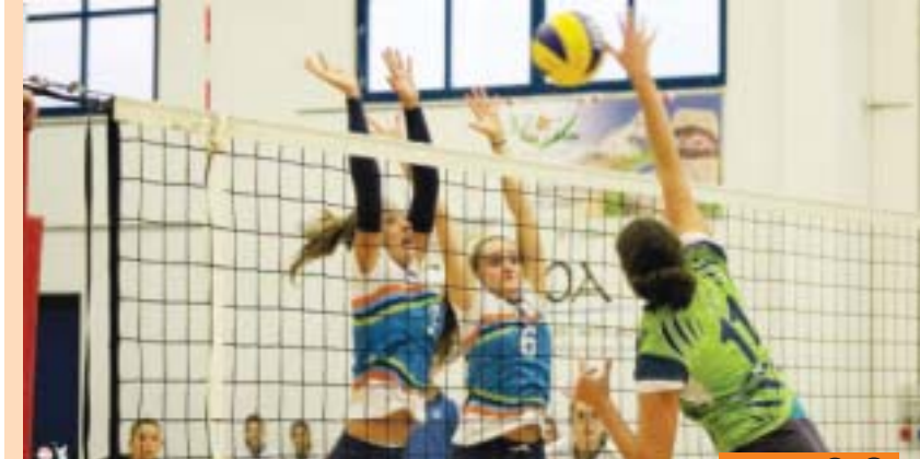
Nel fine settimana prendono il via i vari campionati delle biancoblu