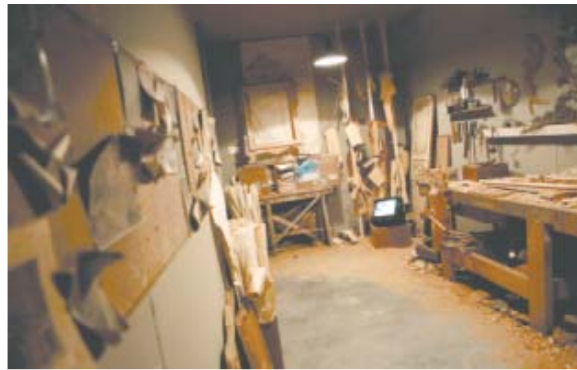
Un'immagine dell'edizione 2015 della Mostra di artigianato

SALUZZO - Due performer francesi da qualche giorno vivono nel centro di Saluzzo, condividendo la loro intimità domestica con gli spazi urbani.