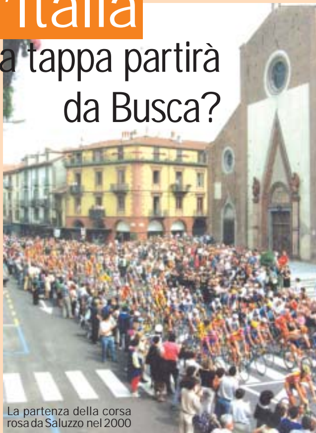
La partenza della corsa rosa da Saluzzo nel 2000

Sarà presente anche il saluzzese nel percorso del Giro d'Italia 2018? Lunedì 18 settembre sono state presentate le prime tre tappe della corsa ciclistica del prossimo anno, ridefinita per l'occasione il "Giro della Pace", visto che partirà in Israele il 4 maggio, con una cronometro nella capitale spirituale del mondo, Gerusalemme. Quindi due frazioni, da Haifa a Tel Aviv e da Be'er Sheva ad Eliat prima di approdare in Italia.