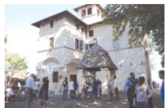
Molta gente per la riapertura di Villa Radicati