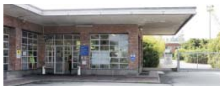
L'ingresso dello stabilimento di Verzuolo

VERZUOLO - Chi si aspettava qualche novità dall'incontro fissato per venerdì 18 maggio scorso in Regione a Torino per fare il punto sulla crisi della Burgo è rimasto deluso: nessun accenno al piano industriale o a nuove prospettive di produzione da parte del Gruppo, semmai le novità sono giunte dall'assessorato regionale al lavoro.