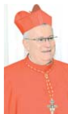
Il card. Bassetti

Il card. Gualtiero Bassetti, arcivescovo di Perugia-Città della Pieve, succede al card. Angelo Bagnasco alla guida della Cei (Conferenza episcopale italiana). La nomina è stata ufficializzata mercoledì 24 maggio da Papa Francesco. Nato nel 1942 in una frazione del Comune di Marradi (Fi), è stato ordinato sacerdote il 29 giugno 1966. Dopo i primi anni di ministero, nel 1992 diventa vicario generale dell'arcidiocesi di Firenze. Due anni dopo viene