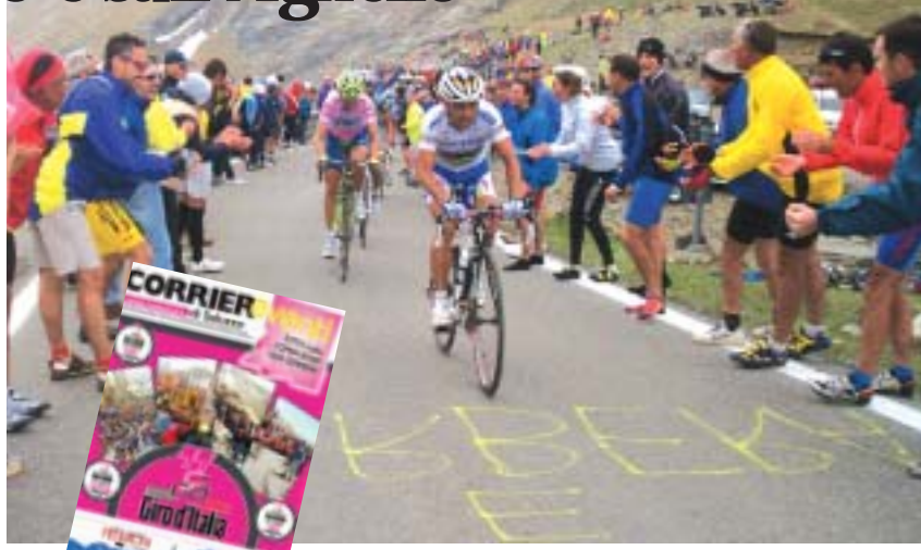
Inserito speciale di 12 pagine

IL CASO All'origine alcune bollette non pagate