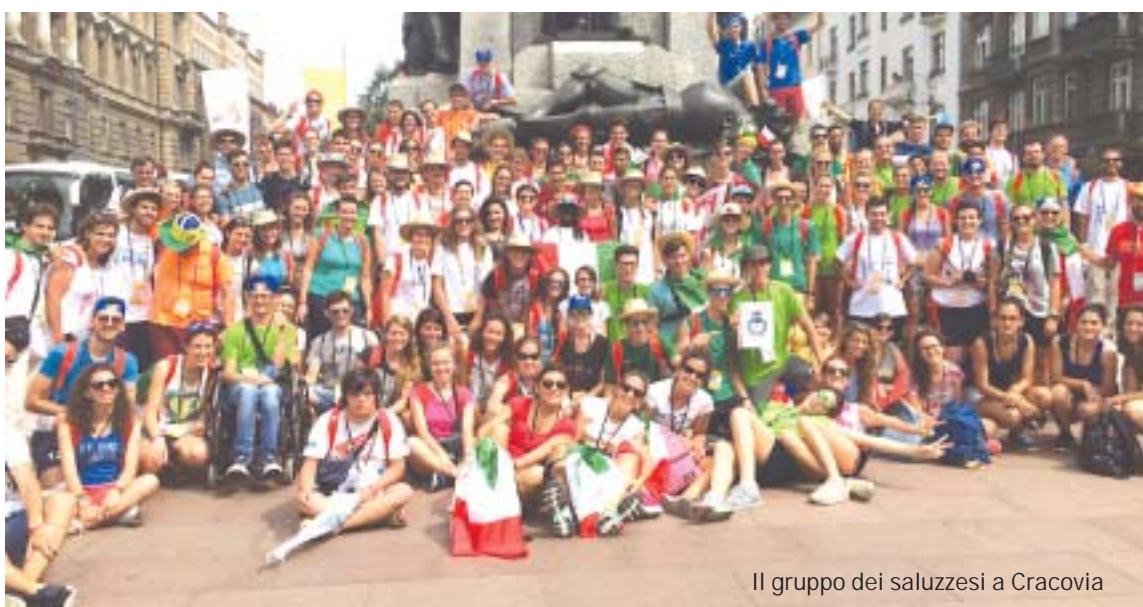
Il gruppo dei saluzzesi a Cracovia