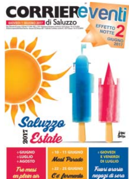
La copertina dell'inserito di 8 pagine dedicato a Saluzzo estate

nomici in piazza con ristoranti, pizzerie, bar e locali notturni aderenti e ancora prove bizzarre, performance in bici e giocoleria su mono ruota. In occasione di Effetto Notte è stata riproposta la navetta gratuita con partenze alle 19.30 da Paesana a Sampyre e ritorno da Saluzzo all'una presso la stazione Ati. I collegamenti con la parte alta della città sono garantiti dal servizio Navetta Minibus scoperto dal Duomo alla Castiglia ogni 30 minuti. Meat Parade, C'è Fermento, Festa della Musica, Marchesato Opera Festival, cinema all'aperto, Fuori orario con negozi aperti il venerdì sera durante luglio, sono solo alcune delle tante iniziative in programma in questi mesi. Tutte le iniziative e le date in programma sono indicate nell'inserito allegato al nostro giornale.